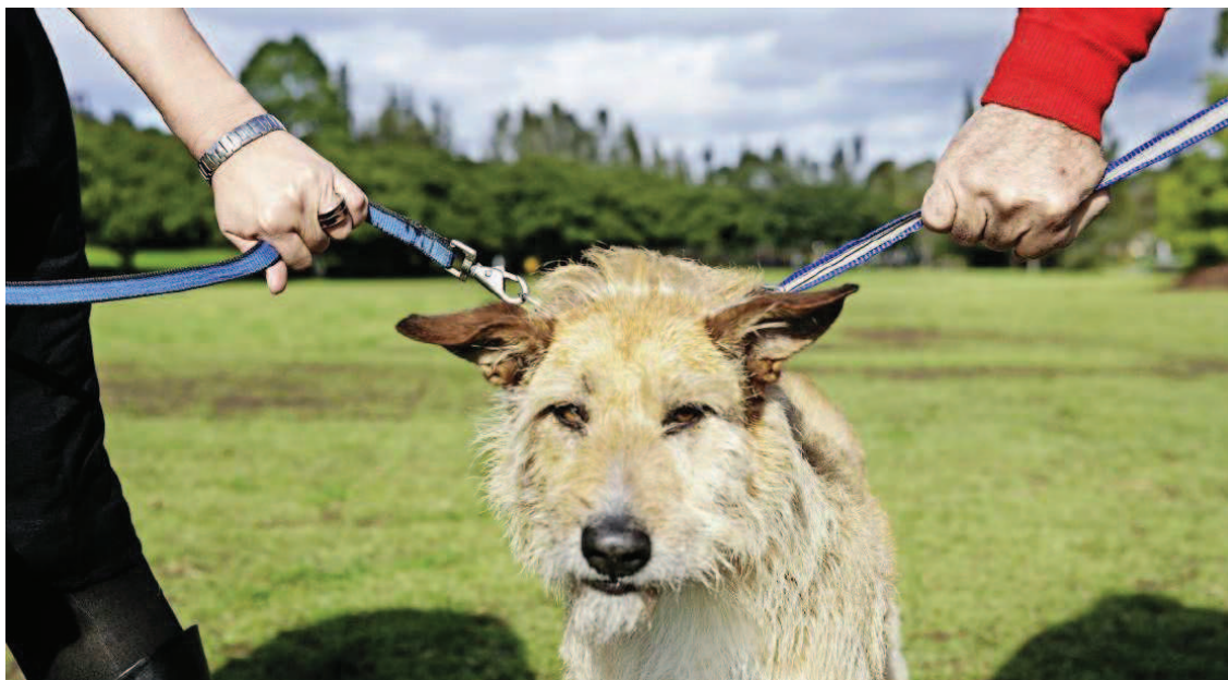
Wer bekommt den Hund? Eine Scheidung ist nicht nur aus emotionalen Gründen schwierig. Je nach Kanton kann das Verfahren ins Geld gehen.